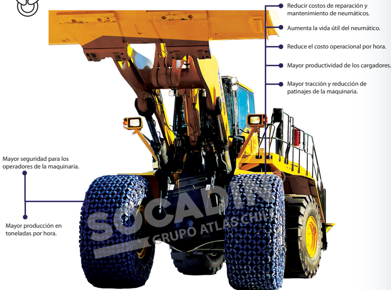
Mayor seguridad para los operadores de la maquinaria.